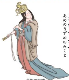
天宇受売命 あめのうずめのみこと