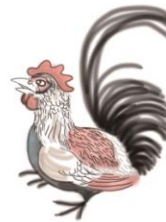
長鳴鳥 ながなきどり