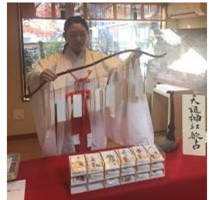
弓の弦から歌占の短冊をひく

この歌占には江戸時代につくられた「天岩戸開」絵馬（天祖神社蔵、板橋区登録文化財）に描かれた神々や狛犬像（御嶽神社蔵、板橋区登録文化財）のおみくじも含まれており、日本古来の信仰に基づく地域の文