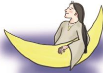
月読命 つくよみのみこと