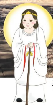
おおひるめのかみ 大日靈貴 太陽の女神