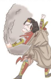
天手力雄神 あめのたぢからおのかみ