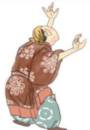
太玉命 ふとたまのみこと