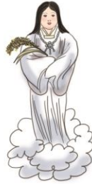
豊受氣毘売神 とようけびめのかみ