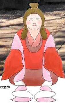
おおみやのめのかみ 大宮売神 コミュニケーションの女神