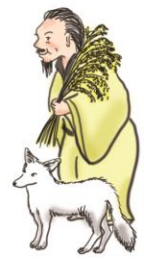
宇迦之御魂神 うかのみたまのかみ