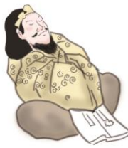
思兼神 おもいかねのかみ