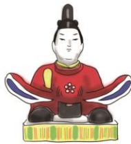
天神さま てんじんさま