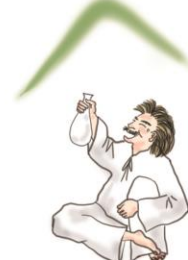
大山咋神 おおやまくいのかみ