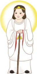
大日靈貴 おおひるめのみこと