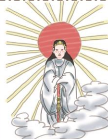
天照大御神 あまてらすおほみかみ