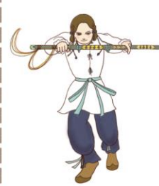
倭建命 やまとたけるのみこと