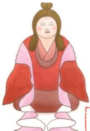
大宮売神 おおみやめのかみ