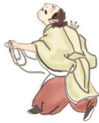
天児屋命 あめのこやねのみこと