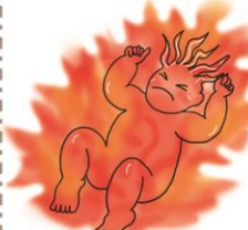
火産霊神 ほむすびのかみ