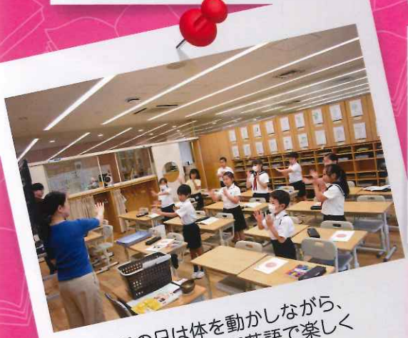
この日は体を動かしながら、リズムに乗って英語で楽しく音読をしました。