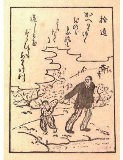
『悟り方圖解』第一図「拾遺」1917 (大正6) 年