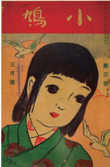
『小鳩』第三卷三月号 1921 (大正10) 年