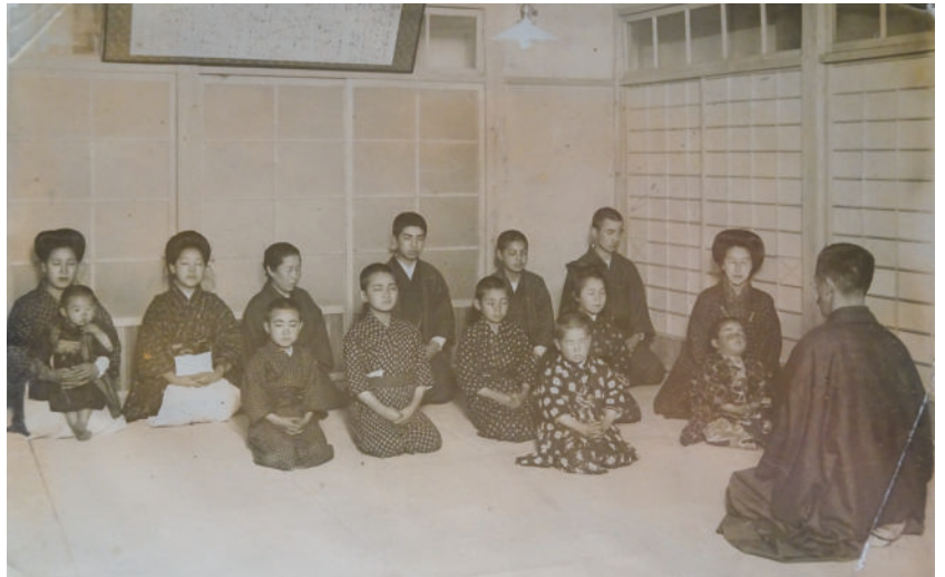
春二独自の教育法「凝念」の様子