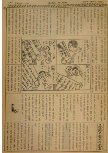
『かなのめばえ』 1921 (大正10) 年4月