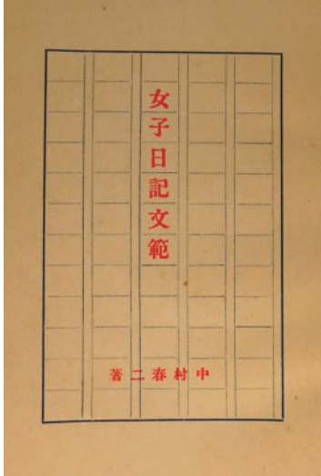
『女子日記文範』扉 1920 (大正9) 年