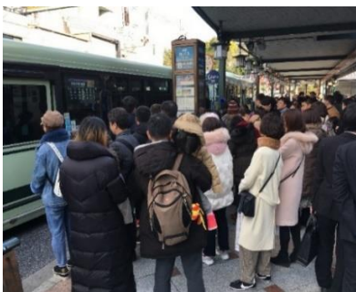
京都のバス停の様子 (2019年1月 筆者撮影)

続いて、前時までの学習を生かし、京都市内で生じている観光公害の状況を事例として、観光が地域に与える影響について資料をもとに考えていきました。新聞記事やインターネットを使ったり、子どもによっては京都市内に住む親せきや知り合いから情報を収集したりしていきました。京都市内は観光客の増加に伴い様々な問題が生じていることをつかみます。例えば、外国人観光客の増加によって路線バスの乗車に関するトラブルが発生していること、食べ歩きのマナー違反があることなど、観光客が集中することで住民の生活環境が脅かされている事実を知りました。