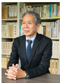
株式会社マヌ都市建築研究所 取締役会長 一級建築士

成蹊小学校、成蹊中学校・高等学校、横浜国立大学工学部建築学科を卒業後、株式会社マヌ都市建築研究所に入社。歴史的建造物の保全、都市再開発、まちづくりに関する調査・計画などに幅広く取り組む。現在は、旧赤星鉄馬邸の保存・活用プロジェクトにも参画している。