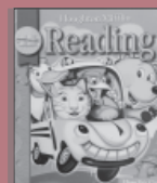
第2回ではアメリカの1年生の教科書を使用します。