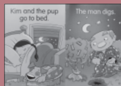
Building Blocks Library (mpi 出版物)