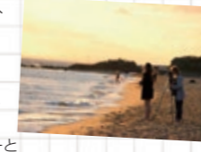
週末は少し遠出してビーチに出かけたり、市内の公園でスケボーなどをしてリフレッシュ。ホストファミリー宅でパーティをしたり、ファザーと出かけることも。アクティブなファミリーだったので、ホームステイは楽しい思い出ばかりです。