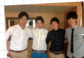
最終日のフェアウェルパーティーで

※2014年度より留学生生舎(3食分のミルククーポン付)での宿泊形態に変更になりました。