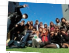
成蹊生とシティに出かけました。