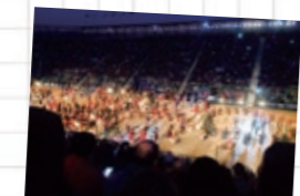
エディンバラ城にて行われるミラタリー・トゥー

エディンバラ城はイギリスの王室文化を知ること、学校帰りに行くことができます。8月は毎晩、ミラタリー・トゥーというイベントが行われていて、スコットランドの伝統衣装キルトを着たパブパイプ奏者の行進やタータンチェックのスカートを履いて伝統ダンス「ケリー」が披露されます。世界中の文化が交わる幻想的なステージは感動的。ミラタリー・トゥーは日本から予約していくことをオススメします。