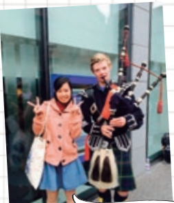
イケメンバグパイパーに遭遇。 街中至るところで演奏や パフォーマンスをする人を見かけます。