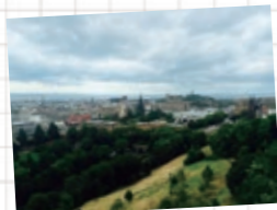
エディンバラ城からの眺望 旧市街と新市街が混ざった、世界遺産に 登録されたエディンバラの美しい風景が 一望できます