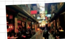
メルボルンシティの裏道

Q. サマースクールに参加した理由を教えてください! 高校時代に培った英語力が本場オーストラリアでどこまで通じるのか、試してみたかったから。