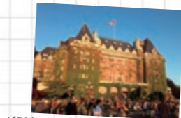
ビクトリア市内にあるヨーロッパ調建物