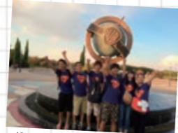
マドリッドにあるテマターク

ホストマザーが「うまくスペイン語が離せなくても、部屋に閉じこもらず傍に来て話す姿勢が素晴らしい」と言ってくれ、拙い会話も根気よく理解しようとしてくれました。意思疎通ができるようになったときは本当にうれしかったです。