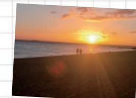
セントキルダビーチの夕日は言葉が失うほどの絶景