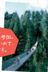
ノースバンクーバーにある世界一長い吊橋「キャピラノ吊橋」

※2014年度より留学生生舎(3食分のミルククーポン付)での宿泊形態に変更になりました。