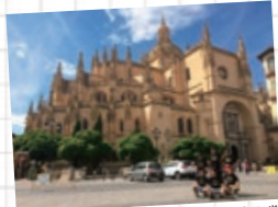
セゴビア カテドラル(ゴシック様式の大聖堂)