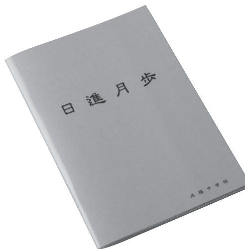
『日進月歩』週間計画表(中学2年生男子の例)