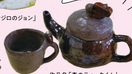
作品名「森のティータイム」