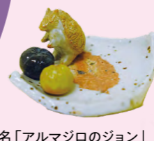
作品名「アルマジロのジョン」

「陶芸の森」の中には、動物や食べものをテーマにした作品がズラリ。製作者のコメント一つひとつに、愛情を感じました。