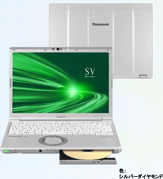
色： シルバーダイヤモンド

一般の保険は 事故報告書の作成・提出が必要となり、審査通過まで時間がかかります(約2~3週間)