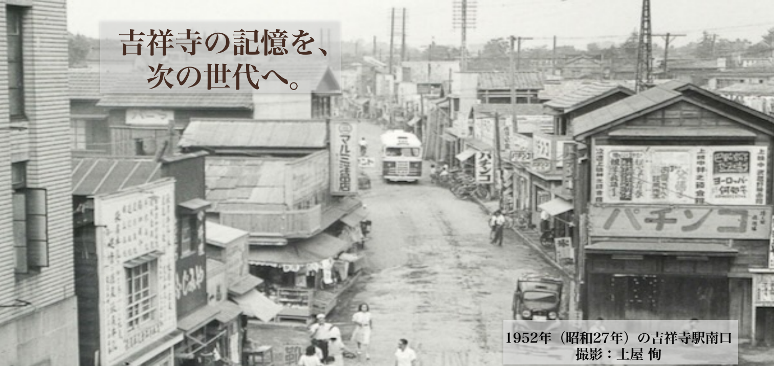
1952年（昭和27年）の吉祥寺駅南口