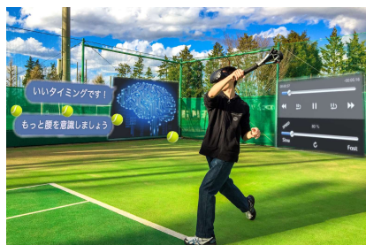
VRと全天球動画を利用したe-sportsシステム