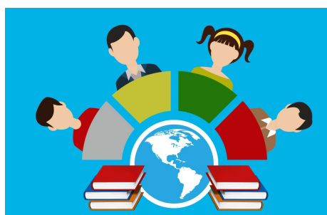
コロナ対応自宅テスト 大規模オンライン講義 平等な教育機会