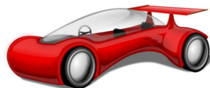
自動運転車 サービスロボット