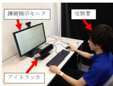
視線追跡装置を利用したカンニング検出システム