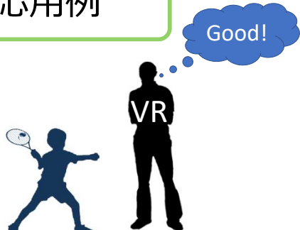
時と場所を選ばず、レベルの高いVRコーチからの的確なアドバイス