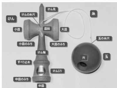
図1：けん玉の各部位の名称 (公益社団法人日本けん玉協会 2024)